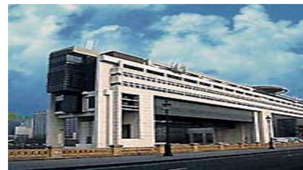
Ministère des finances Bercy